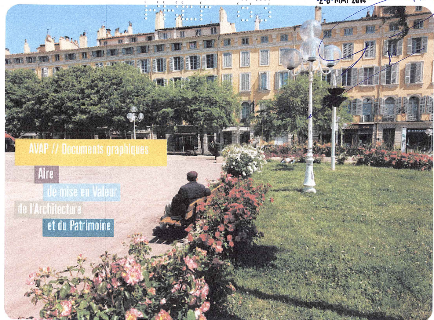
AVAP // Documents graphiques Aire de mise en Valeur de l'Architecture et du Patrimoine

AVAP créée le 29 mai 2014 Vu et approuvé pour être annexé à la délibération du 2-8 MAI 2014... N° 2014-13-15