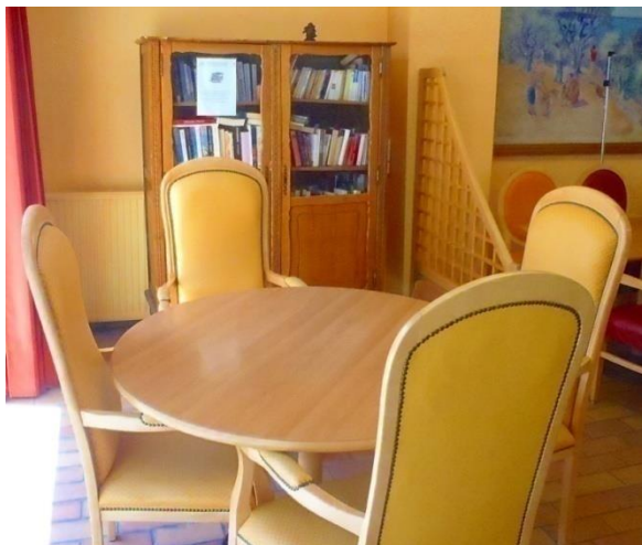
Le coin jeux de société – bibliothèque

Les frais et honoraires de ces prestations sont à votre charge.