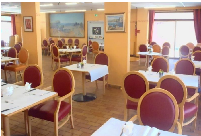
La salle du restaurant

Vous prenez votre petit déjeuner chez vous, nous vous livrons une fois par mois les ingrédients sur commande.