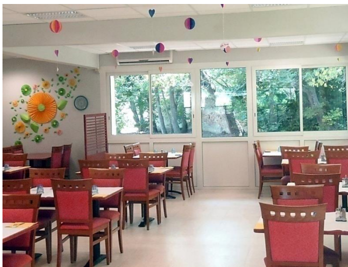
La salle du restaurant

Vous prenez votre petit déjeuner chez vous, nous vous livrons une fois par mois les ingrédients sur commande.